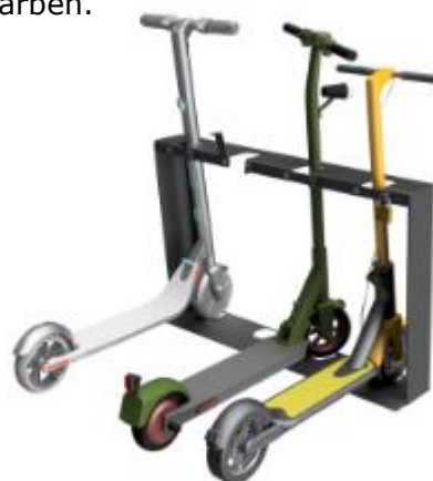
TIDY E-SCOOTER-STÄNDER 193E